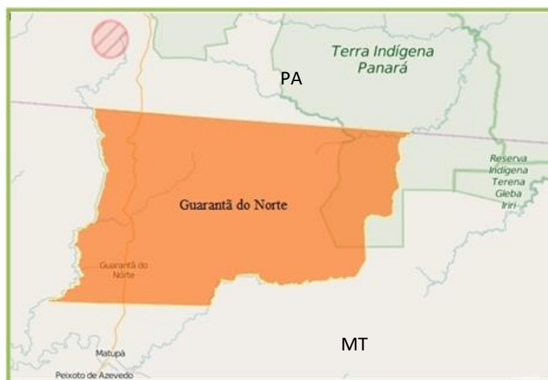
Figura 1: Recorte municipal de Guarant do Norte-MT.

Resoluo Ad Referendum CONSUP/IFMT n 149, de 30 de Setembro de 2016 – Autorizao de Funcionamento do curso.